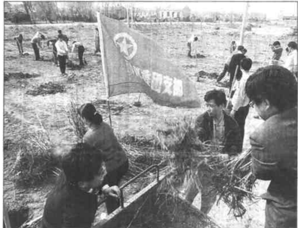
市科委驻利津县虎滩乡北苏村包村组针对该村自然条件和经济基础较差等实际情况，确立了“路域绿化美化村庄，庭院绿化富一家”的工作思路，争取1.8万元购置了冬寒苗及绿化

根据年度统计情况和业内人士分析，我市股份有限公司99年度业绩良好，除个别股份公司由于特殊原因呈阶段性亏损或利润较低外，绝大多数公司股东收益比较丰厚，年终红利或送股、配股平稳兑现。目前，华泰纸业争取上市工作正在紧张进行，科达、万达等公司也正积极筹备上市，整个股份公司发展前景乐观。(常凤鸣 康晓平)